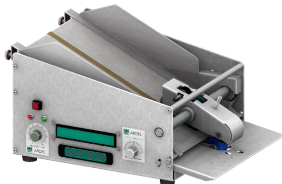
CP - GUIAS ESTANDAR - PEDAL